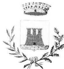
Comune di Castellaneta