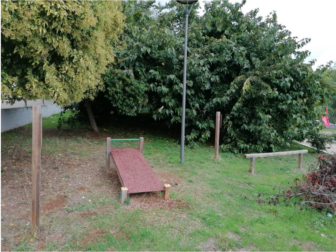
Attrezzature per attività sportive