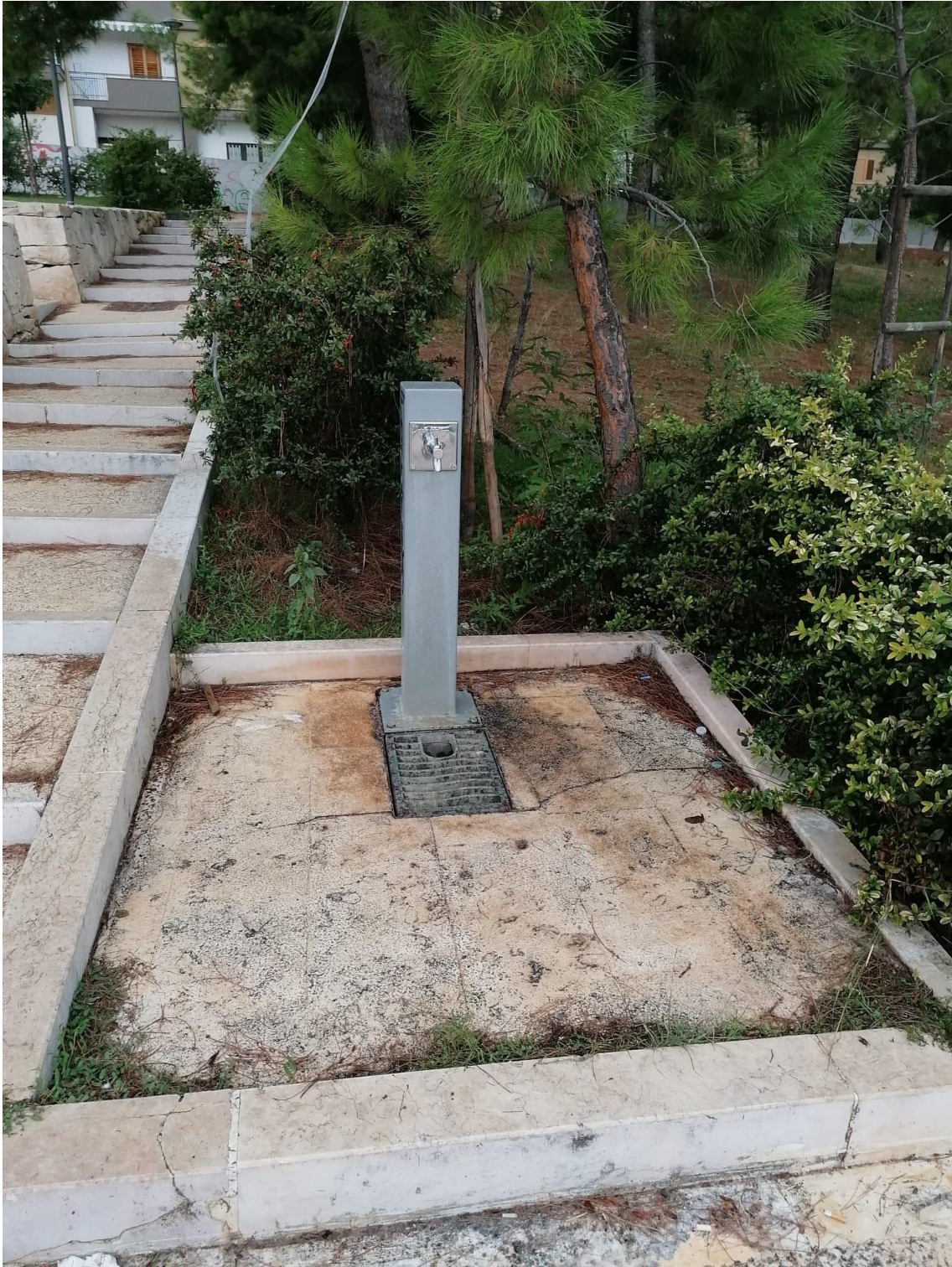
Fontana alimentata ad acqua potabile