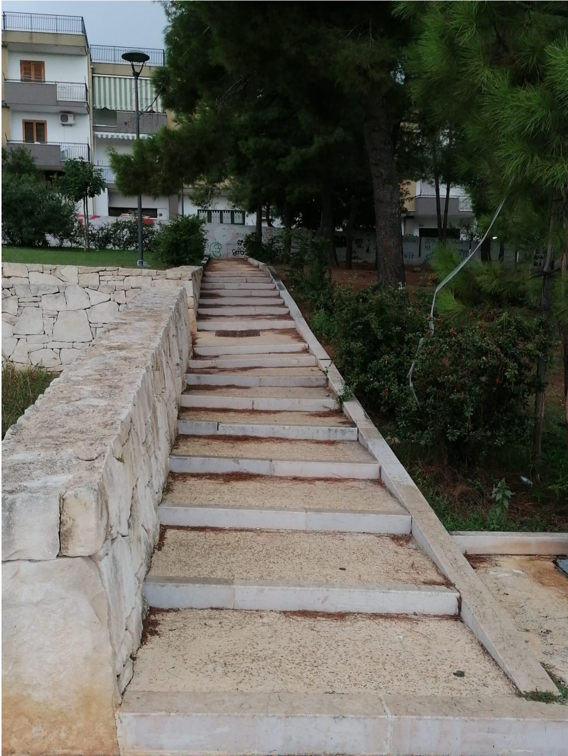
Scalinata di accesso