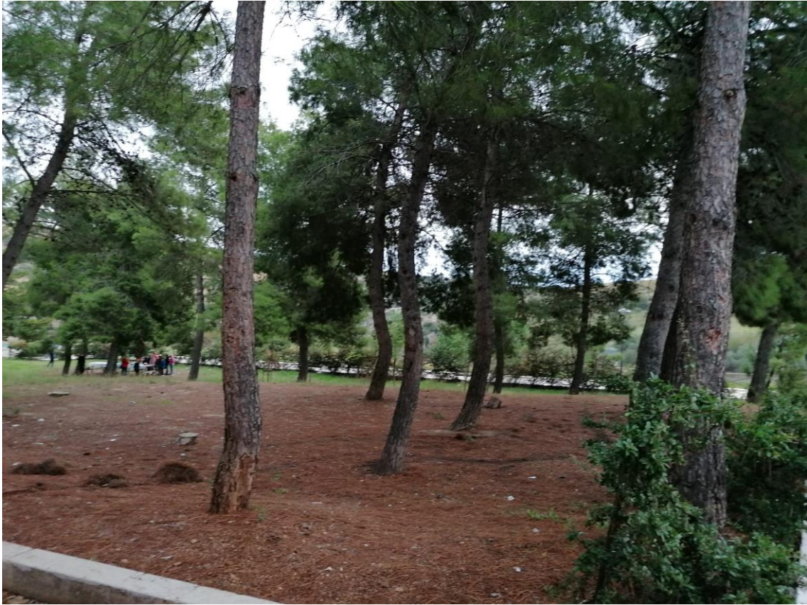
Pineta attrezzata per pic nic